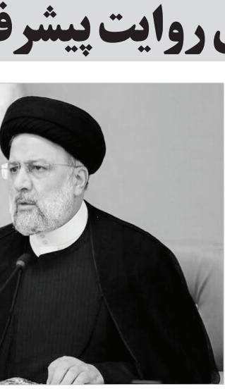
سید ابراهیم رئیسی، رئیس‌جمهور ایران

اعلام کرد و اظهار داشت: نرخ رشد پایه پولی نیز که در ابتدای سال ۴۵ درصد بود، در حال حاضر به ۳۸/۵ درصد رسیده و با تدابیر اتخاذ شده و اقدامات در حال انجام تا پایان سال به زیر ۳۰ درصد خواهد رسید.