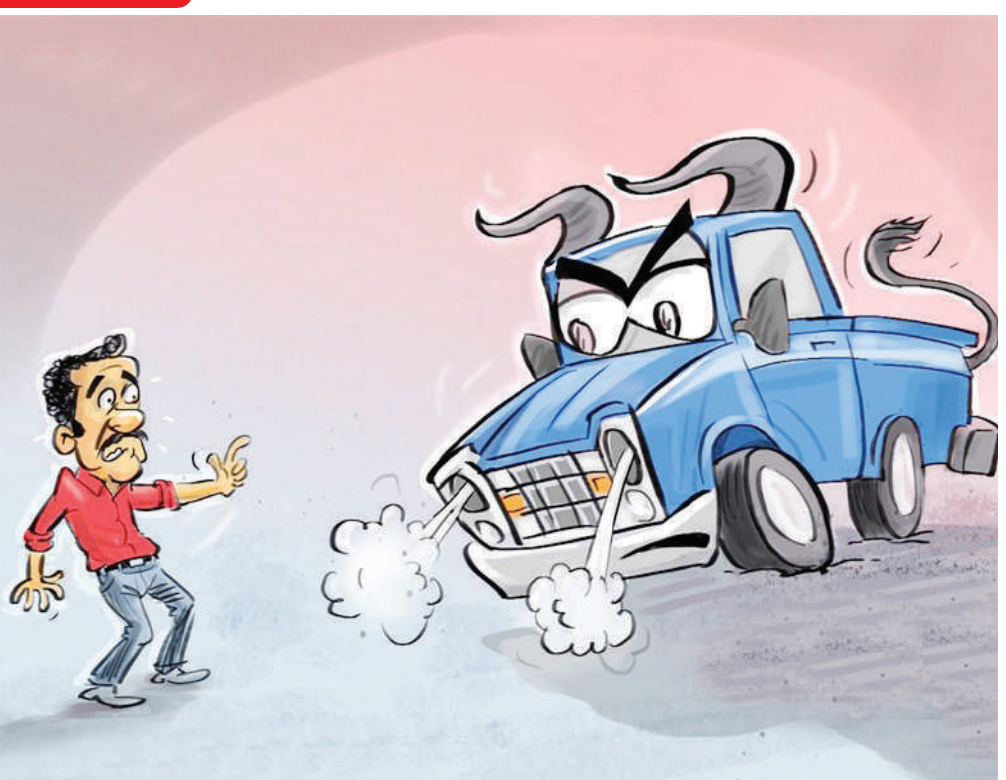
پرواز قیمت وانت محبوب نیشان آبی نیم‌میلیارد شد