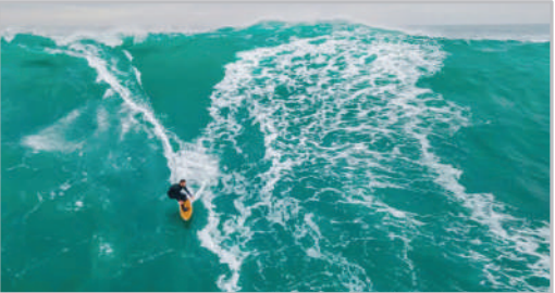
موج‌سواری - سواحل پرتغال