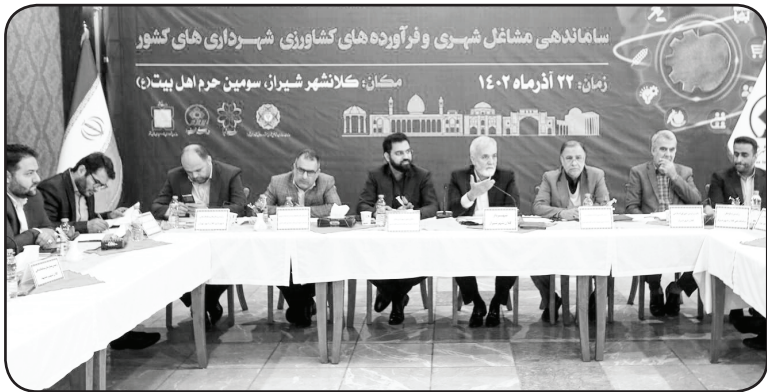
عکس: شهر شیراز

این کلید ویژه دنبال می‌گردد، خاطر‌نشان کرد: احداث بازارچه و سامان‌دهی مشاغل مزاحم دوتا از این کلید واژه‌ها است و در شهر شیراز ۴۳ بازارچه فعال هستند. رئیس کمیسیون خدمات شهری و محیط زیست شورا با اشاره به اینکه یکی از اشکالات در اداره بازارچه نیم نگاه انتفاعی است عنوان کرد: اگر شهرداری‌های قرار است خدمتی ارائه کنند باید یک مسیر مستقیم تعریف شود و این موضوع معادلات اقتصادی و سازوکار خودش را دارد.