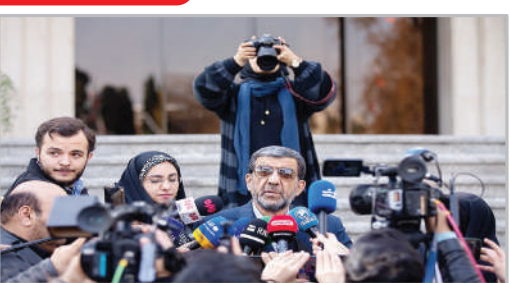
در حاشیه جلسه هیئت دولت