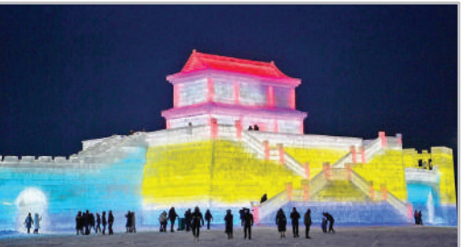
نمایشگاه سالانه سازه‌های برقی و یخی - هاربین چین