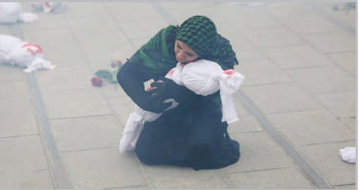
نمایش خیابانی مظلومیت غزه - همدان